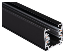
33232 TEAR N TR 2M-W

Přímá spojka typu „I“ vnitřní do systému